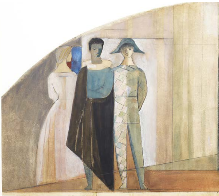
Boceto del mural del teatro de la universidad laboral de Zamora año 1984, Autora: Delby Tejero.